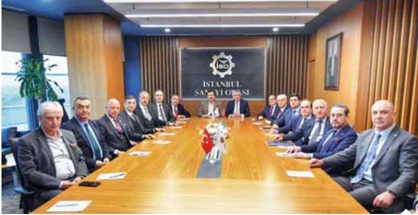
12 sanayi odasının başkanı afetin yaralarını sarmak için seferber oldu.

Depremzede sanayiye destek için "Tedarikçim Deprem Bölgesinden" projesini başlatan Türkiye Odalar ve Borsalar Birliği (TOBB), büyük ölçekli şirketleri, ham madde ve yarı mamul tedariklerini afet bölgesinde üretim yapan firmalardan karşılamaya davet etti.