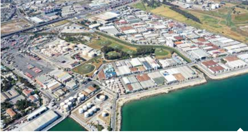
Mersin Serbest Bölgesi'nde 292 yerli ve 101 yabancı sermayeli şirket faaliyet gösteriyor.

Mersin Serbest Bölgesi, 2022 yılında bir önceki yıla göre yüzde 19 artış sağlayarak 4,01 milyar dolarlık ticaret hacmine ulaştı. Geçen yıl 1 milyon 871 bin 132 ton elleçleme yapılan bölgede işlem gören malların yüzde 81'ini sanayi ürünleri, yüzde 19'unu tarım ürünleri oluşturdu.