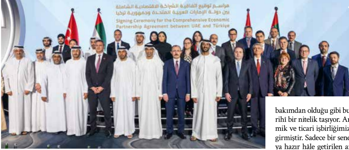
Ticaret Bakanı Mehmet Muş, BAE'deki törende Türkiye Cumhuriyeti adına anlaşmayı imzaladı.