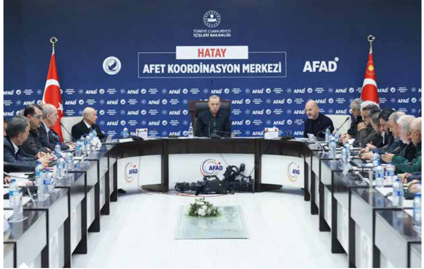
Cumhurbaşkanı Recep Tayyip Erdoğan, deprem bölgesindeki incelemelerinin ardından ekonomik tedbirler ve desteklere ilişkin açıklamalarda bulundu.

4,4 milyar TL değerindeki söz konusu destek paketi, yüzde 90 oranında kefalet oranına sahip. Paket aracılığıyla; mal ve hizmet üretimi, serbest meslek ya da ticari faaliyete yönelik yeni bir iş yeri açmak isteyen ya da bir iş fikrine dayalı olarak faaliyet gösteren gerçek kişi / tüzel kişi işletme sahibi kadın girişimciler ve kadın kooperatiflerinin desteklenmesi amaçlanıyor. Destek ile son bir yıl içinde kurulmuş işletmeler ile hiç teminatı olmayan işletmelere öncelik verilecek.