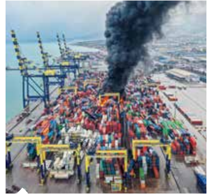
3 ve 4'üncü rıhtımlarda kimyasal madde yüklü konteynerler güçlükle söndürüldü.

Deprem ve depremin tetiklediği yangın felaketi sonrasında operasyonlara bir an önce geri dönebilmek için çalışmaların devam ettiği Limakport İskenderun'da devrilen ve hasar gören konteynerlerin stok sahasına yayılarak yeniden istiflenmesi ve hasar tespit çalışmalarının